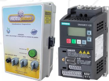
Figura 1 – Quadro inversor CONFORT de 2,0 cv e Inversor Siemens V20 M/F 220 V 2,0 cv

Título: Solução da falha F3 nos inversores Siemens V20 utilizado nos quadros de comando Confort e Plus de 2,0 cv e 3,0 cv