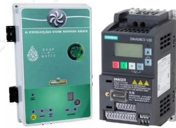
Figura 2 – Quadro inversor PLUS de 2,0 cv e Inversor Siemens V20 M/F 220 V 2,0 cv