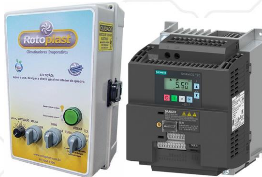
Figura 3 – Quadro inversor CONFORT de 3,0 cv e Inversor Siemens V20 M/F 220 V 3,0 cv